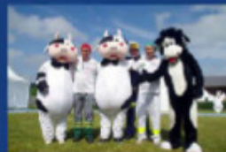
Animateurs et animatrices !