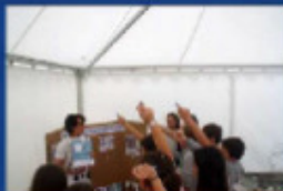
Jeu pédagogique sur le