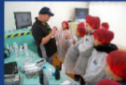
...et les démos de Logoplaste