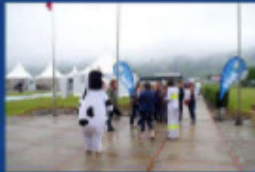
L'accueil des classes par notre animatrice en chef

Succès mémorable pour cette journée Portes Ouvertes ... aux écoles le 1 er juin