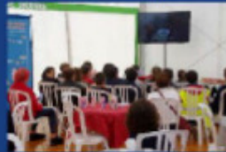
Captivés par les vidéos...