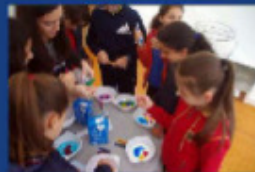
Atelier du « Lait magique »