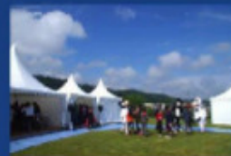
Belle ambiance et ciel bleu