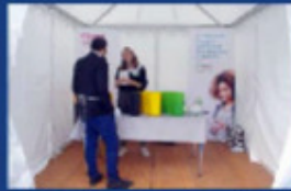
CITEO et le recyclage en général