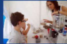
Tetra Pak et le pulpeur : comment recycler une brique