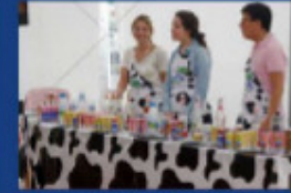
Dégustation lait et Sirops Monin