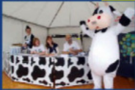
L'accueil dans la bonne humeur