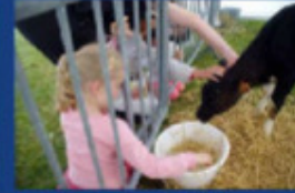
Oklahoma, 1 mois, fait le bonheur des enfants