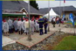
On se bouscule pour la visite