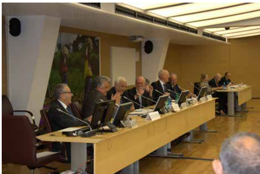
Podio dell'AG 2017 tenutasi nella sede dell'IFAD