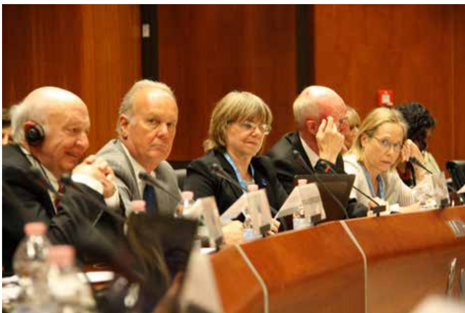
Catherine Bertini, emerito Direttore Esecutivo del PAM, parla all'AG 2016 tenutasi al PAM