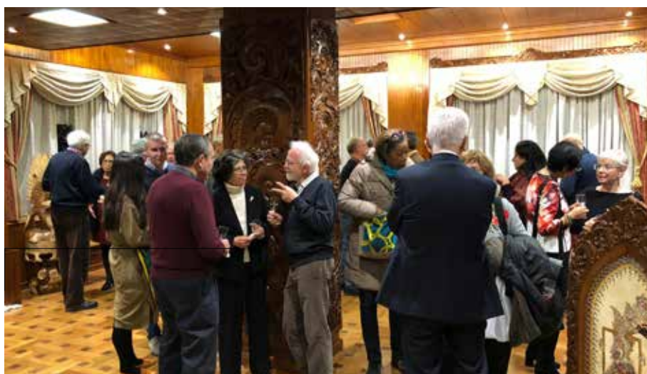
Un recente Party di Fine Anno della FFOA tenutosi nella Sala Indonesia della FAO