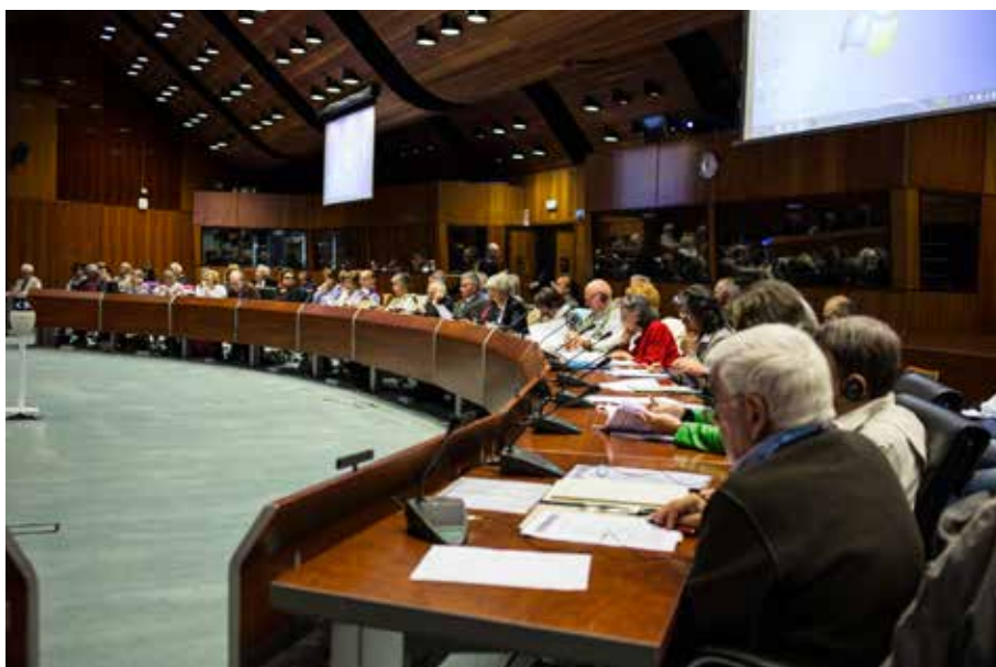
Soci della FFOA partecipano all'AG 2015 tenutasi presso l'Auditorium del PAM