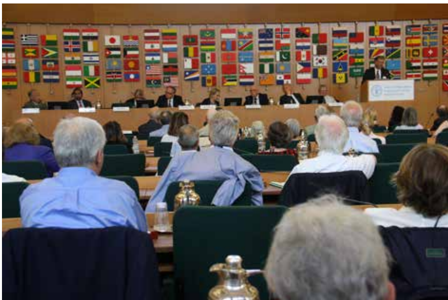
Podio dell'AG 2015 tenutasi presso la sede della FAO