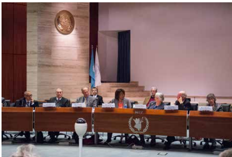
Ertharin Cousin, Direttore Esecutivo del PAM , parla all'AG 2013 tenutasi al PAM