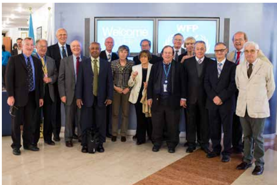
Gruppo del Comitato Esecutivo della FFOA all'AG 2013 tenutasi presso la sede del PAM