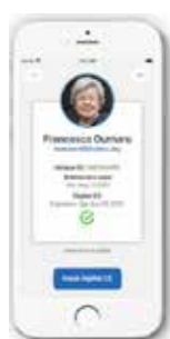
Certificato di Esistenza in Vita (CE) Digitale

A partire dal 2021, con i nuovi pensionati, il Fondo Pensione delle Nazioni Unite (UNJSPF) lancerà una nuova applicazione basata sul riconoscimento facciale e sulla catena di blocchi (blockchain) in alternativa al Certificato di Esistenza in Vita (CE) cartaceo che i pensionati sono tenuti a inviare ogni anno per ricevere i loro benefici.