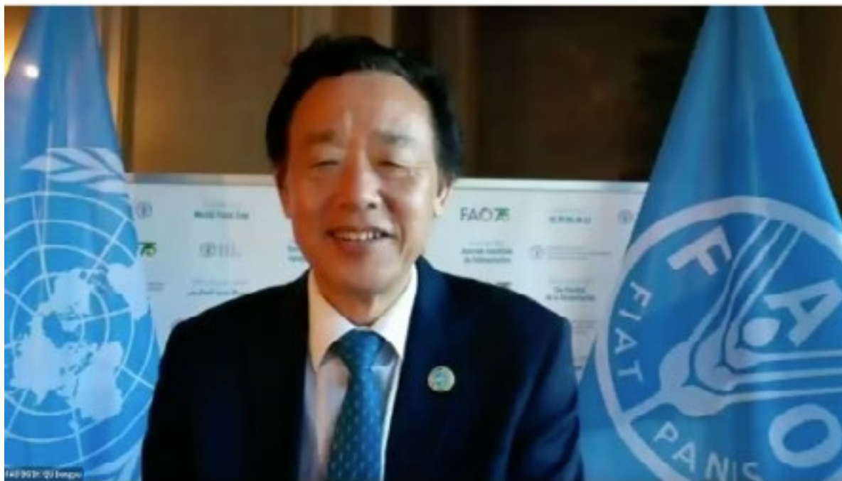
Direttore Generale della FAO, Dott. QU Dongyu

La Presidente osserva che in precedenza la FFOA ha cercato di lavorare per un unico contratto per le tre Agenzie con sede a Roma, ma sfortunatamente non è stato così;